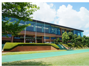
メディカルトレーニングセンター