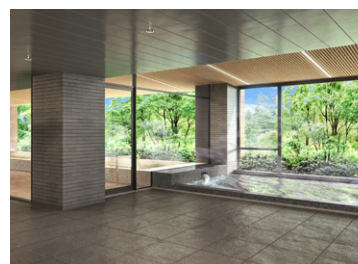
天然湯の華風呂 長柄カルナの湯