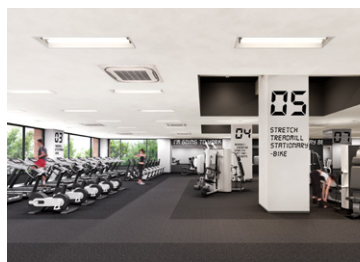
フィットネスルーム