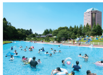
ラク・レマン プール(夏季)