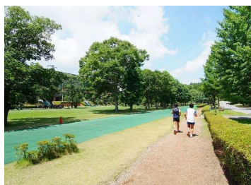
フィンネンパーンジョギングコース