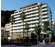
熱海温泉 ホテル・サンミ倶楽部

〒413-0023 静岡県熱海市和田浜南町5-8 TEL.0557-81-8000 https://www.sunmi.co.jp/