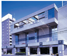
北海道 ふとみ銘泉 万葉の湯

〒061-3776 北海道石狩郡当別町太美町1695 TEL.0133-26-2130