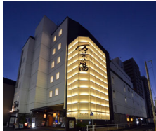
小田原お堀端 万葉の湯

〒250-0011 神奈川県小田原市栄町1-5-14 TEL.0465-23-1126