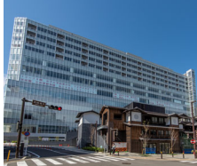
天成園 小田原駅 別館

〒250-0011 神奈川県小田原市栄町1-1-15 TEL.0460-83-8080 https://odawara.tenseien.co.jp/