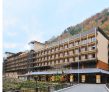
箱根湯本温泉 天成園

〒250-0311 神奈川県東武郡下都賀町湯本682 TEL.0460-83-8500 https://www.tenseien.co.jp/