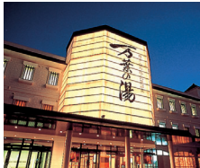
博多 由布院・武雄温泉 万葉の湯

〒812-0042 福岡県福岡市博多区豊2-3-66 TEL.092-452-4126