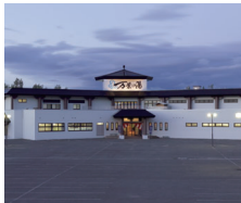
旭川高砂台 万葉の湯

〒070-8061 北海道旭川市高砂台1-1-52 TEL.0166-62-8910