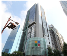
神戸ハーバーランド温泉 万葉倶楽部

〒650-0044 兵庫県神戸市中央区東川崎町1-8-1 TEL.078-371-4126