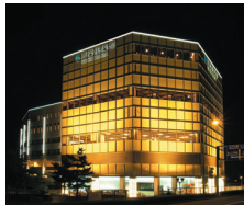
横浜みなとみらい 万葉倶楽部

〒231-0001 神奈川県横浜市中区新港2-7-1 TEL.0570-07-4126