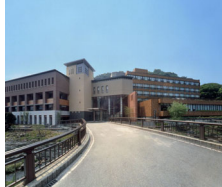
湯河原温泉 ニューウェルシティ湯河原

〒413-0001 静岡県熱海市泉107 TEL.0465-63-3721 https://www.welcity-yugawara.co.jp/