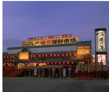
沼津・湯河原温泉 万葉の湯

〒410-0011 静岡県沼津市岡宮1208-1 TEL.055-927-4126