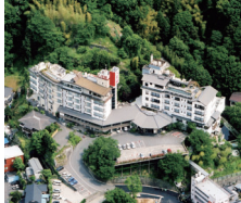
伊豆長岡温泉 ニュー八景園

〒410-2211 静岡県伊豆市の国市長岡211 TEL.055-948-1500 https://www.hakkeien.jp/