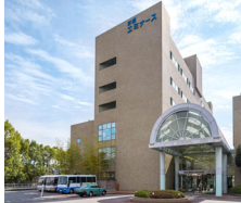
京都 竹の郷温泉 ホテル京都エミナース

〒610-1143 京都府京都市西京区大原野東境台町2-4 TEL.075-332-5800 https://www.k-eminence.com/