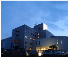
はだの・湯河原温泉 万葉の湯

〒257-0032 神奈川県秦野市河原町2-54 TEL.0463-85-4126