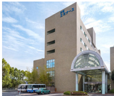
京都 竹の郷温泉 万葉の湯

〒610-1143 京都府京都市西京区大原野東境台町2-4 TEL.075-333-4126